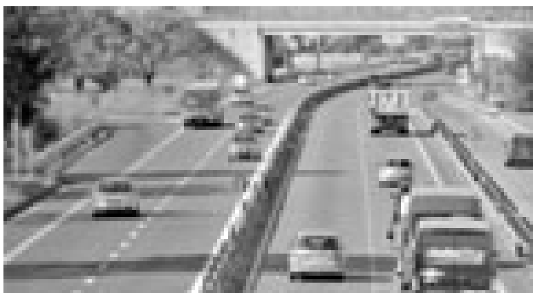
Strano destino per la nuova Pontina